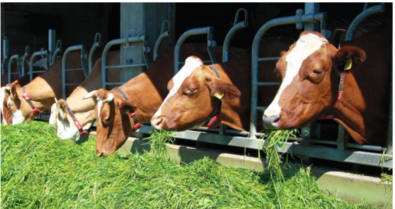
Ab 2022 noch wichtiger: Qualitativ gutes Raufutter für Milchkühe.

Stimmen die Mitgliedorganisationen dieser Weisung diesen Sommer zu, wäre die physische Trennung der Futtermittelkomponenten aus der Schweiz und dem Ausland auch