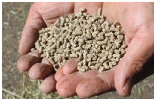
Die Kraftfutterkomponenten für Wiederkäuerfutter müssen ab 2022 ausschliesslich aus der Schweiz stammen.

Ohne Importe von Knospe-Futtermitteln für Wiederkäuer müssen die Landwirte noch stärker als bisher sicherstellen,