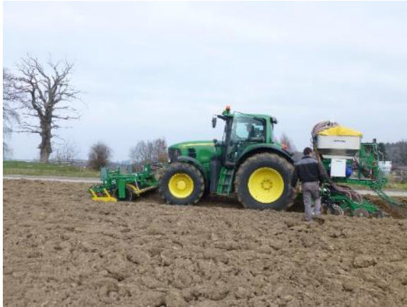
Abbildung 1: Saat der Versuchsstreifen ohne vorgängige Saatbettvorbereitung der gepflügten Parzelle mit einer Direktsaatmaschine. Davon erhofft man sich eine genügend tiefe Saatgutablage sowie einen Beitrag zur Vermeidung von Erosionsschäden. Givisiez FR, 23.03.2016