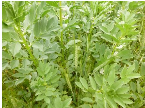
Abbildung 4: Sommerackerbohne Bioro 80 % und Triticale Trado 40 %. Schon jetzt ist die Triticale von der Ackerbohne fast erstickt. Givisiez FR, 30.06.2016