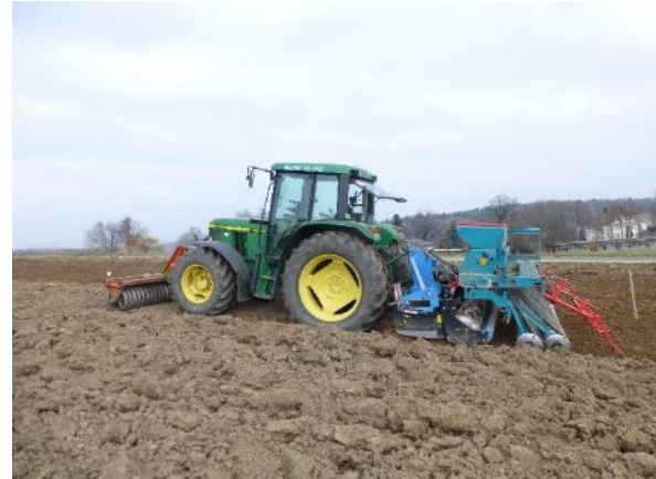
Abbildung 2: Herkömmliche Saatkombination (= Getreidesämaschine und Kreisleger), um nur einen Versuchsstreifen in 3 cm Tiefe zu säen. In einem sehr trockenen Jahr wie 2015 hätte dieses Saatverfahren schlecht abgeschnitten, um Leguminosen wie die Ackerbohne zu säen. Givisiez FR, 23.03.2016

Die Saat und das Auflaufen der Kultur verliefen erfolgreich. Da aber der Lohnunternehmer den Druck der Traktorreifen nicht ausreichend vermindert hat, ergaben sich daraus in den tiefergelegenen Traktorspuren Bodendruckschäden, die sich auf die Kulturen als Folge der sehr nassen Witterung des Frühlings 2016 als nachteilig auswirkten. Unterhalb der Traktorspuren kam es gemäss Spatenproben zu Sauerstoffmangelerscheinungen und Wurzeln mit kümmerlichem Wachstum.