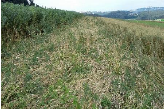
Abbildung 9: Links die Mischung Ackerbohne Bioro 80 % und Triticale Trado 40 %; in der Mitte, die gelagerte Mischung Lupine Boruta 80 % mit Triticale Trado 40 %; rechts die Mischung Lupine Boruta 80 % mit Sommerhafer Zorro 40 %. Grangeneuve FR, 25.07.2016