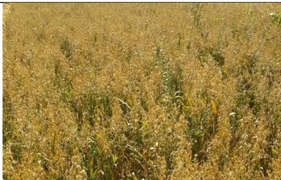
Abbildung 11: Boruta / Zorro. Man sieht schon hier, dass dieses Verfahren noch das ertragreichste sein wird. Allerdings sieht man wenig Lupinen! Strickhof ZH, 02.06.2016

Die Lupinen präsentierten sich an diesem Tag unbefriedigend: der Bestand war dünn und nur schwach mit Knöllchen besiedelt, was sich auch an der hellgrünen Farbe zeigte. Vermutlich litten sie unter den anhaltend nassen Bedingungen des Frühsommers, kombiniert mit der Staunässe des Standortes. Die Ernte erfolgte am 15.08.2016. Die beiden Verfahren mit Triticale waren sehr stark verunkrautet, insbesondere das Verfahren mit der unverzweigt wachsenden Sorte Boruta mit Triticale, das unter starkem Ackerwindendruck litt. Aus diesem Grund war das Erntegut feucht und musste nachgetrocknet werden. Die Mischung mit Hafer war etwas besser. Die verzweigt wachsende Sorte Boregine hatte eine ungleichmässiger Abreife als Boruta, brachte in der Mischung mit Hafer aber den besten Ertrag der vier Verfahren.