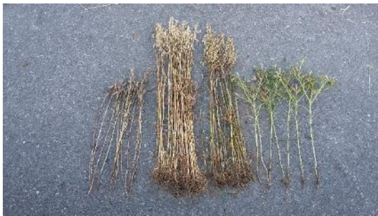
Abbildung 5: Von l. nach r. : blaue Lupine Boruta, Sommerhafer Zorro, Winterhafer Wiland, blaue Lupine Boregine. Mischungen von Lupinen und Hafer hatten kein Unkraut. Givisiez FR, 08.08.2016