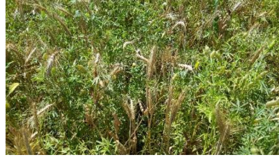
Abbildung 14: Boregine / Trado. Hier spielt die Triticale nur eine Nebenrolle. Dieses Verfahren brachte als Einziges wirtschaftlich annehmbare Ergebnisse, das Erntegut musste aber getrocknet werden. Strickhof ZH, 02.06.2016