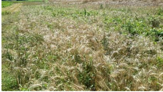
Abbildung 13: Boruta / Trado. Sowohl die Lupinen als auch die Triticale hatten hier Mühe, einen Bestand zu bilden. Hier gaben Ende Juli die Ackerwinden noch den Rest. Strickhof ZH, 02.06.2016