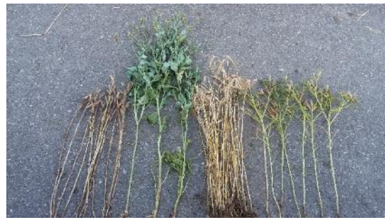
Abbildung 6: Von l. nach r. : blaue Lupine Boruta, Gelbsenf, Triticale Trado, blaue Lupine Boregine. Mischungen von Lupinen und Triticale enthielten etwas Gelbsenf als Unkraut. Givisiez FR, 08.08.2016