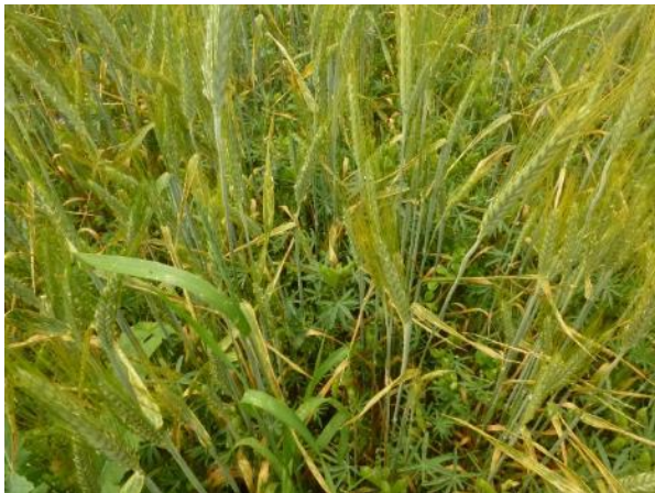
Abbildung 3: Blaue Lupine Boruta 80 % und Triticale Trado 40 %. Givisiez FR, 30.06.2016

Das sind nur Hypothesen, die in den darauffolgenden Jahren verifiziert werden sollten.