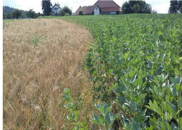
Abbildung 8: Links blaue Lupine Boruta 80 % und Triticale Trado 40 %; rechts Sommerackerbohne Bioro 80 % und Sommerhafer Zorro 40 %. Givisiez, 25.07.2016