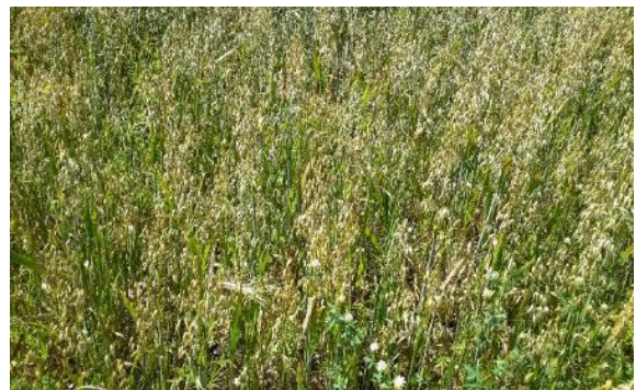
Abbildung 12: Boregine / Zorro. Auch hier sieht man keine Lupinen. Strickhof ZH, 02.06.2016