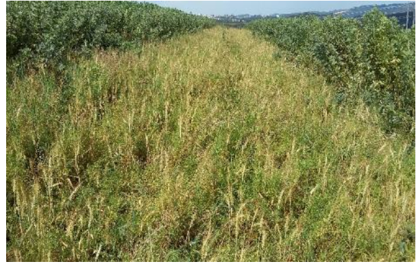
Abbildung 10: Links und rechts sind Ackerbohnenmischungen zu sehen. In der Mitte, die Mischung Linse 80 % und Sommerweizen 20 % und Leindotter 5 kg/ha. Grangeneuve FR, 25.07.2016.

Die Ackerbohne wuchs sehr hoch und erstickte das Getreide fast vollständig; vor der Ernte knickte sie und lagerte stark. Bei den Lupinenmischungen gab es fast keine Lagerung der Mischung von Boruta mit Sommerhafer, hingegen eine starke Lagerung der Mischung von Boruta mit Sommertriticale (siehe Foto).