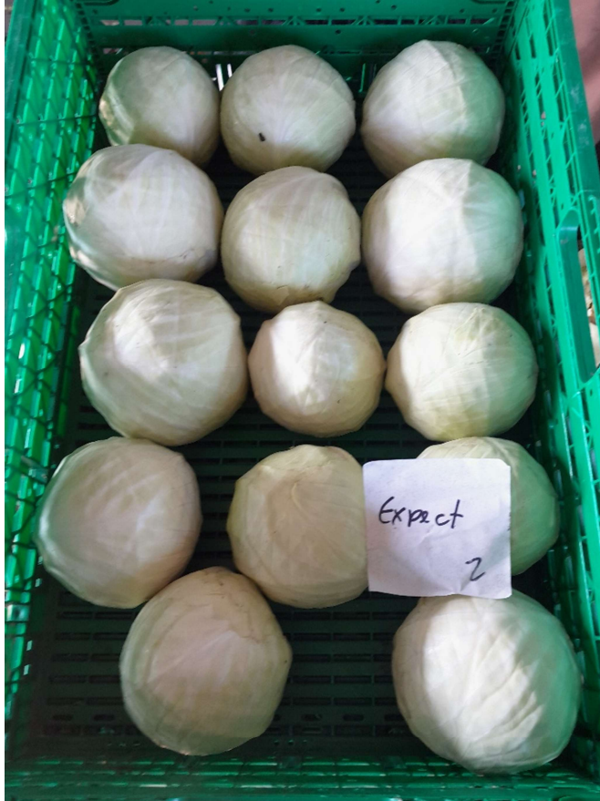
Abb .2. Auffällig regelmässige Köpfe