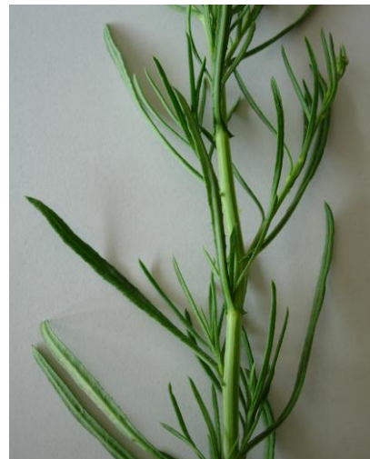
Schmale Blätter, Rand gezähnt oft ganzrandig erscheinend da zurückgerollt