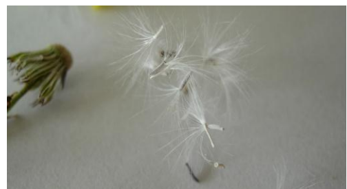
Früchte mit aufgesetztem Pappus (weisser Haarkranz = umgewandelter Kelch)