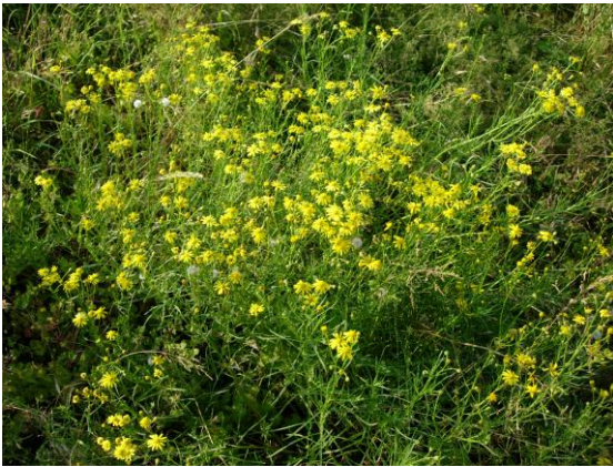
Bestand Senecio inaequidens , Autobahn Lausanne-Genf