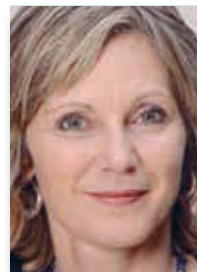
Maya Graf, Präsidentin des Nationalrates, Nationalrätin Grüne BL Mitglied der Wissenschafts-, Bildungs- und Kulturkommission

«Einer der Fusionspartner von Bio Part- ner, Eichberg Bio, hat von Anfang an in- tensiv mit dem FiBL zusammengearbei- tet. Auf dem Eichberg-Hof wurden vom FiBL schon früh zahlreiche Versuche durchgeführt, und man konnte gemein- sam neue Erkenntnisse für den Bioland- bau gewinnen. Die konstruktive Zusam- menarbeit und die Unterstützung vom FiBL schätze ich besonders. Ich wünsche dem FiBL, dass es in Zukunft noch stär-