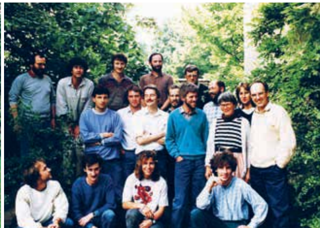
Oberwil Bernhardsberg, Anfang 1990er-Jahre.