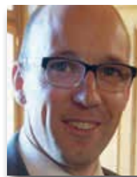
Stefan Müller-Altermatt, Nationalrat (CVP/SO)

«Ich bin sehr überzeugt, dass der biologische Landbau für unser Land von grosser Bedeutung ist. Deshalb stehe ich im Parlament dafür ein, dass die Forschung für die ökologische Landwirtschaft genügend Mittel und gute Strukturen erhält.