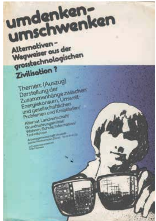
Das junge FiBL beteiligte sich 1975 an der Ausstellung «umdenken – umschwenken».

Einen ausführlichen Bericht finden Sie auf www.fibl.org