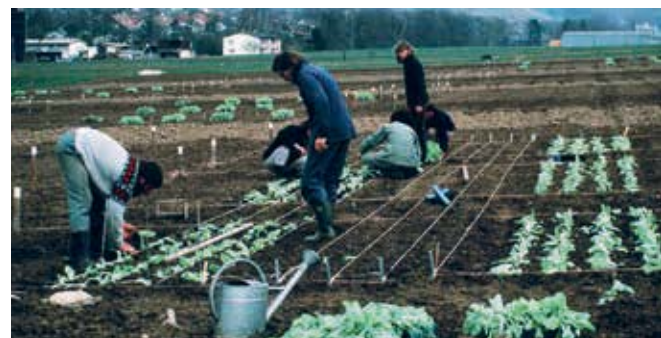
Feldversuche zu Nitrat im Gemüse, Anfang 80er-Jahre in Therwil BL.

Die grösste Leistung war meiner Meinung nach, dass es dem FiBL gelang, den Biolandbau von seinem sektiererischen Image zu befreien. Wissenschaftliche Fortschritte wurden erzielt und Methoden weiterentwickelt. Mindestens so wichtig war das gesellschaftspolitische Engagement des FiBL. Es trug massgebend zur Bekanntheit des biologischen Landbaus bei. Sehr zentral war die Umstellungsberatung. In Vorträgen, Kursen und Publikationen haben die Mitarbeitenden die neuen Erkenntnisse sehr praxisnah verbreitet. Zudem