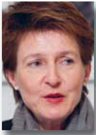
Bundesrätin Simonetta Sommaruga, Vorsteherin des Eidgenössischen Justiz- und Polizeidepartements EJPD

«Gut, gibt's die Forschung für den biologischen Landbau – denn auch Biolebensmittel sollen erforscht, entwickelt und