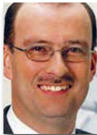
Markus Ritter, Nationalrat (CVP/SG) und Präsident Schweizerischer Bauernverband

Bäuerinnen und Bauern erfüllt werden kann.»