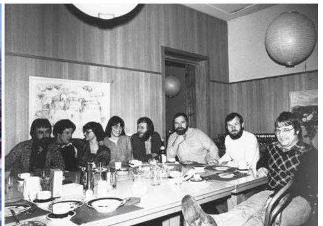
Institut und Team an der Bottmingerstrasse in Oberwil, Ende 1970er-Jahre.