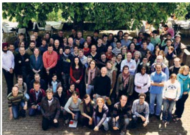
Das Institut und Team in Frick, heute.