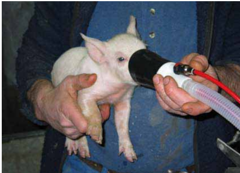
Die beste Übergangslösung? Die Vollnarkose mittels Gas ist kostenintensiv. Und der blutige Eingriff bleibt.

dass die Produktion und Verarbeitung möglich ist.