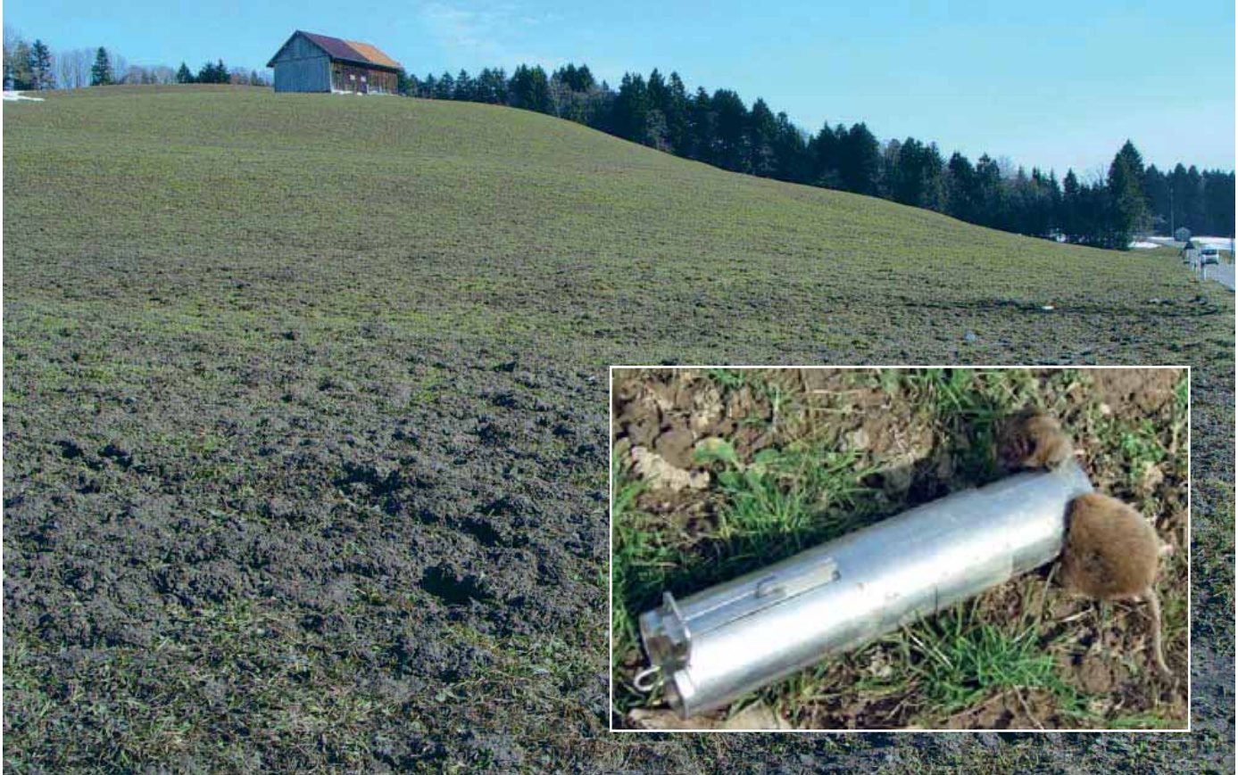
Mäusetotalschaden auf einer Wiese im Kanton St. Gallen und eine der möglichen Bekämpfungsvarianten: die Topcat-Falle.

onszusammenbruch bedeutet sozusagen ein abruptes Ende mit Schrecken. Danach können die Wiesen saniert und die Mäuse für eine Weile vergessen werden.