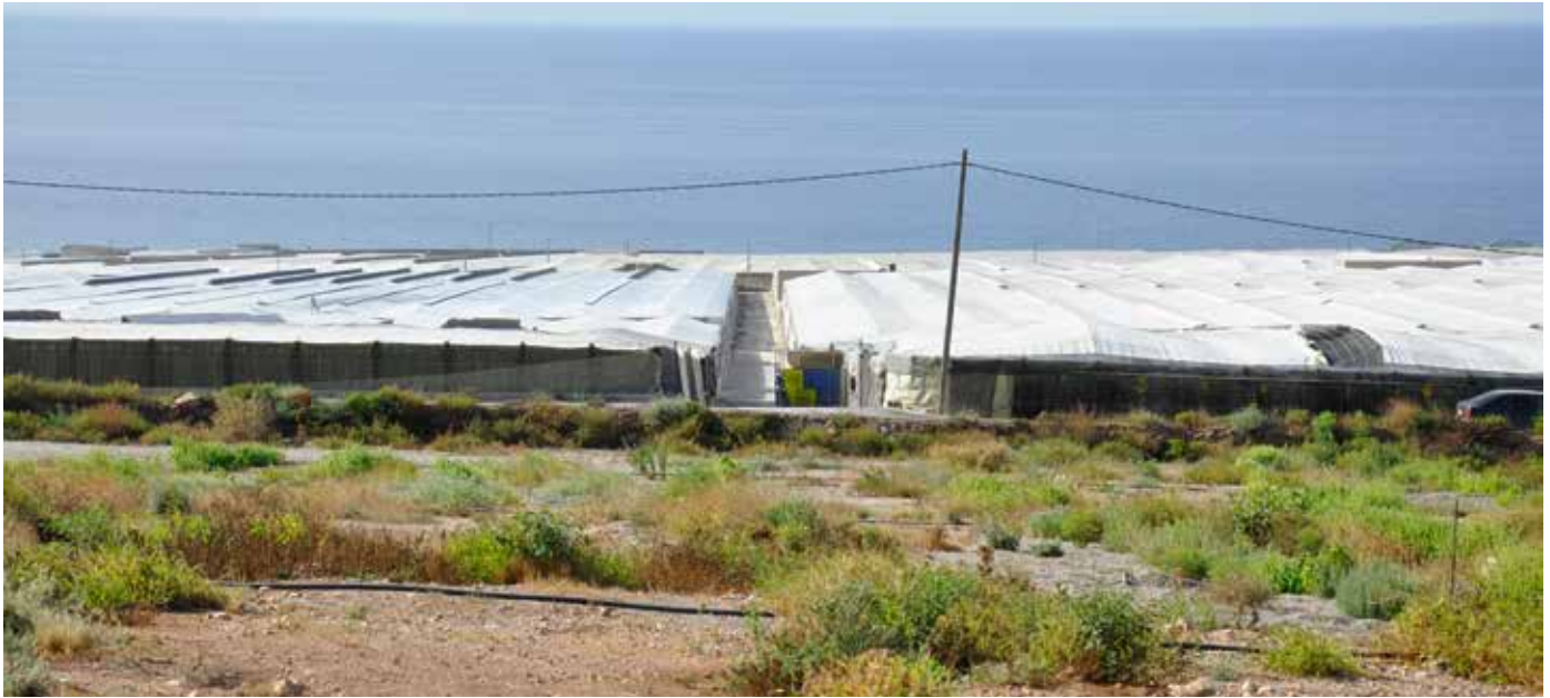
Auch Knospe-Produkte kommen aus den Gewächshäusern von Südspanien in die Schweiz.

on, sodass weitere Massnahmen nötig wurden. Eine neu geschaffene Arbeitsgruppe hat sich vor diesem Hintergrund zunächst mit der Frage befasst, welche der über 60 Anbauländer, aus denen Bio Suisse Produkte importiert werden, als Schwerpunkt für die nächsten Jahre gewählt werden sollten. Grosse importierte Mengen sowie die arbeitsintensivsten Kulturen findet man im Bereich Obst, Gemüse und Kräuter. Diese Kulturen werden vor allem aus Spanien, Italien und Marokko importiert. Deshalb hat die Arbeitsgruppe diese drei als Fokusbänder für 2015 definiert. Die nächste Frage war, welche Kontrollmöglichkeiten sich für soziale Anforderungen anbieten. Dazu erliess der Vorstand eine neue Weisung, wonach die Betriebe in Spanien, Marokko und Italien ab 2015 eine externe Sozialauditierung beziehungsweise eine Sozialzertifizierung einführen müssen.