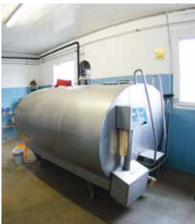
Wärmepumpen sind bei grossen Kühltanks sinnvoll.

Wer etwas Neues baue, solle sich vorab verschiedene bereits umgesetzte Bauten