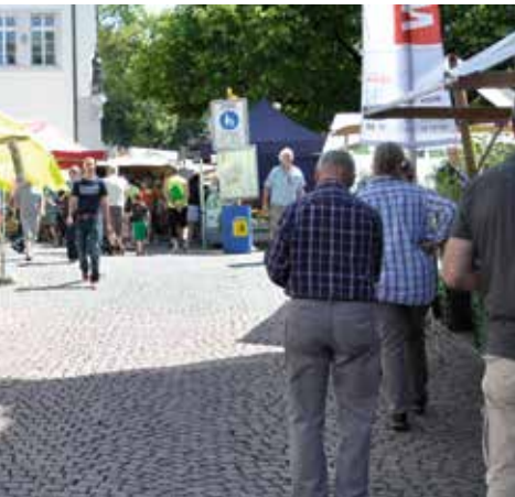
Marché Bio Fribourg, 28. September.