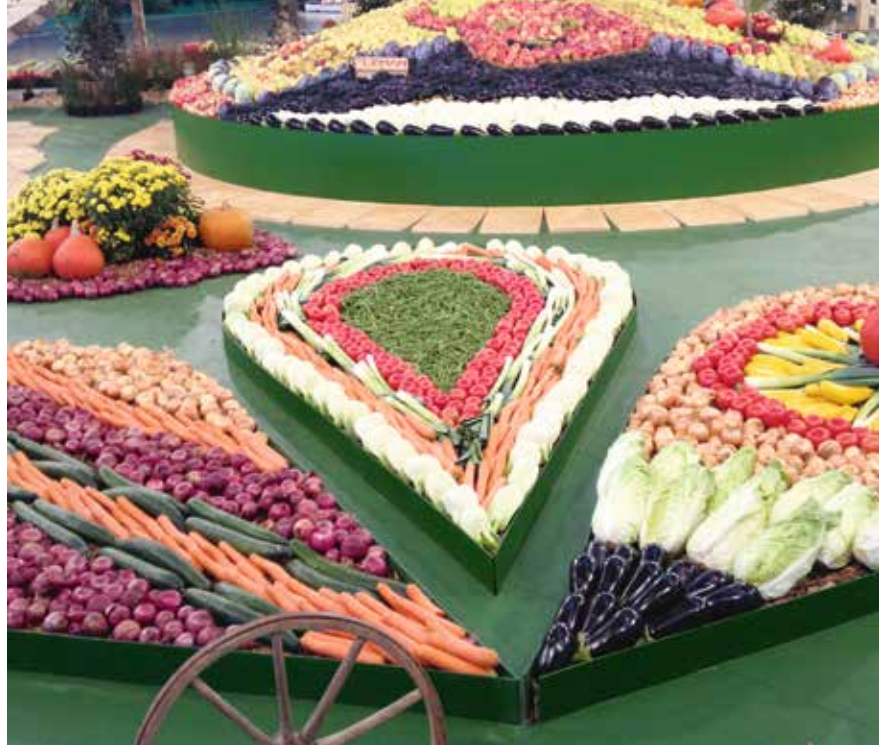
Comptoir Lausanne, 19. bis 28. September.