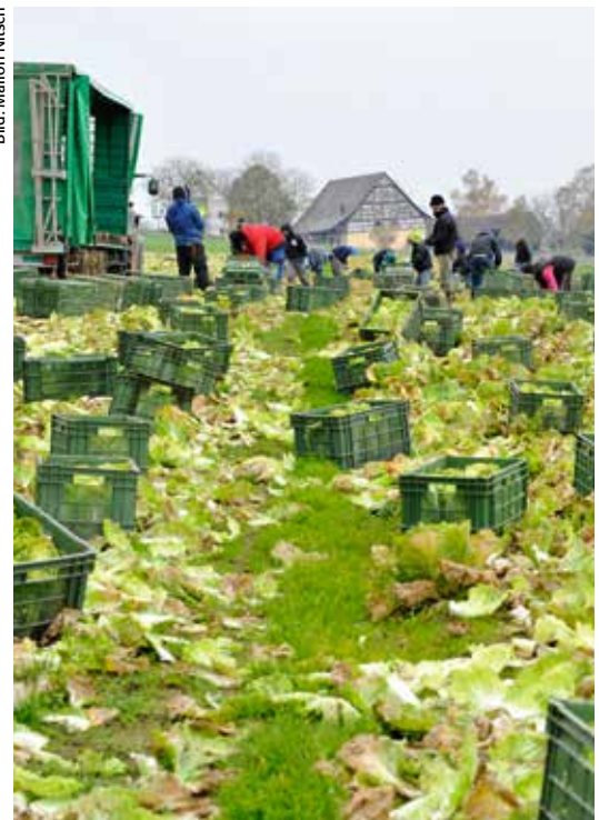
Gemüse-, Obst- und Kartoffelbetriebe müssen ab 2015 wohl mehr für SwissGAP berappen.