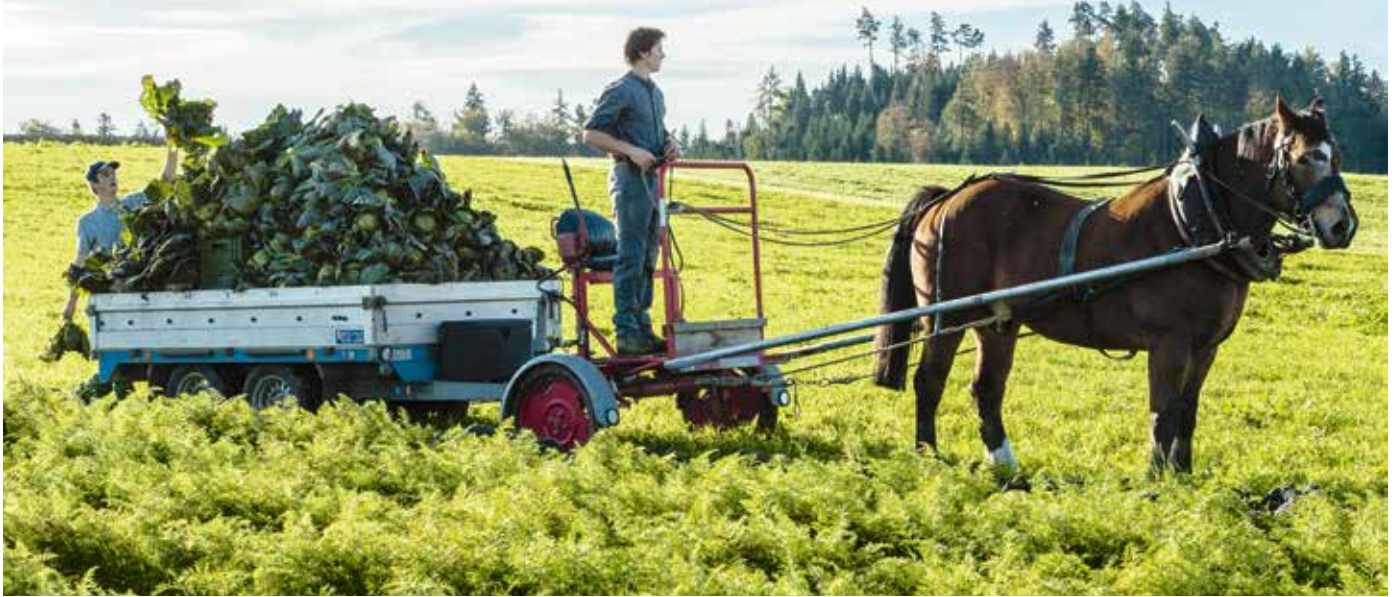
Kohlernte in Krauchthal: Der Autoanhänger hat für die Zugkraft von Arbeitspferd Jurek die ideale Grösse.