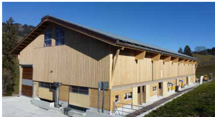
Die Abwärme von Photovoltaikanlagen kann für die Heubelüftung genutzt werden.