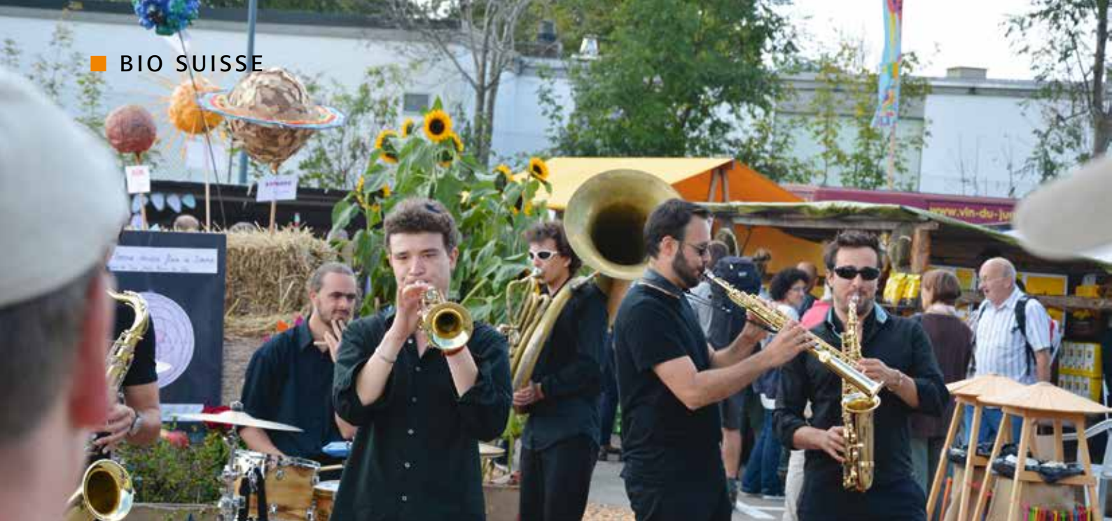
Marché Bio et artisanat Saignelégier JU, 20./21. September