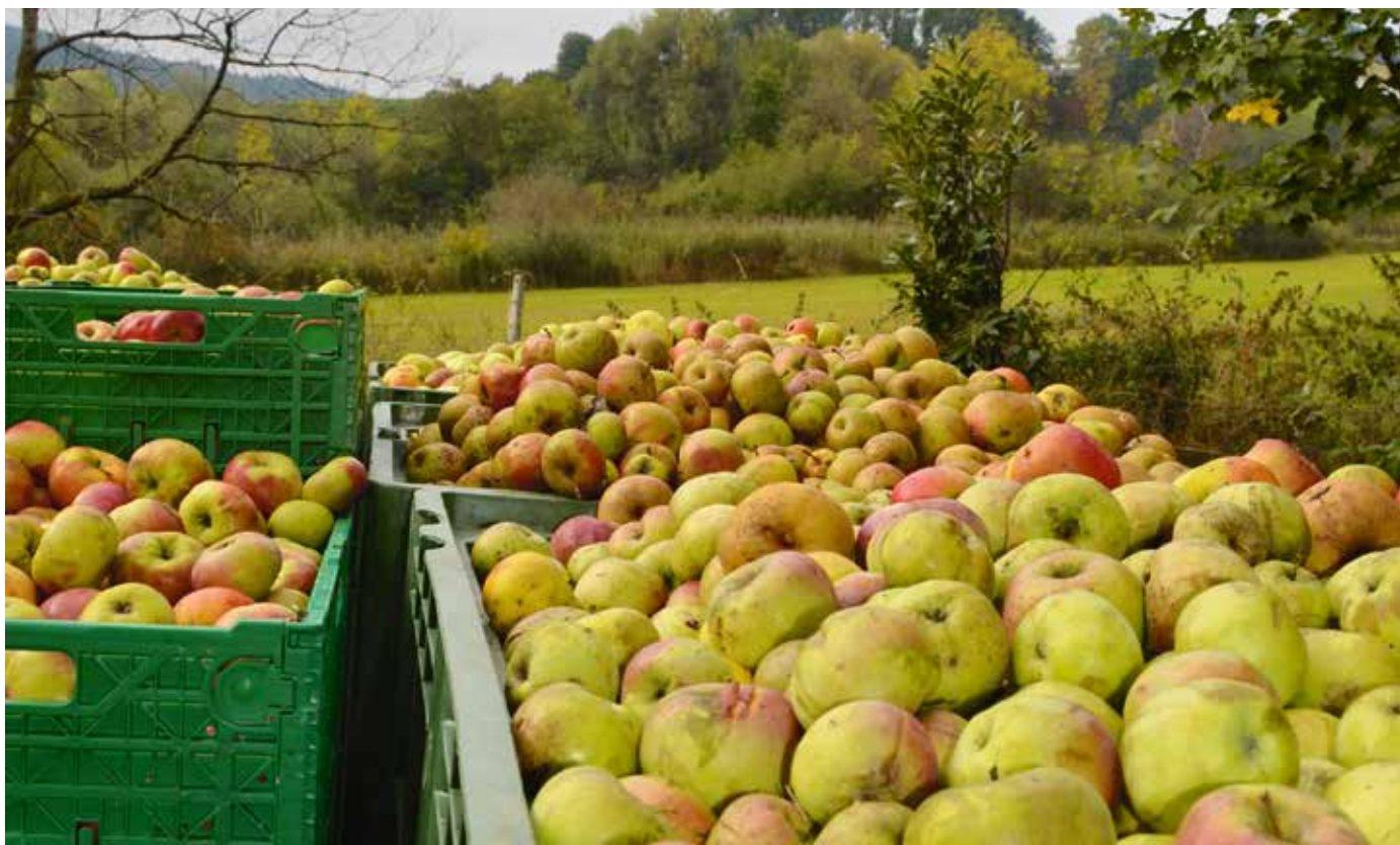
Der Ankaufspreis liegt bei der Cidrerie du Vulcain mit 40 Rappen pro Kilo über dem branchenüblichen Mostobstpreis.