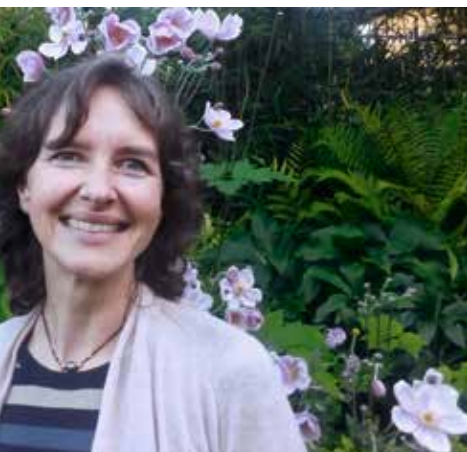
es «Jardins Extraordinaires» wegen gekommen. ogischen Aspekt.»