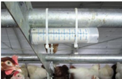
Milbenfalle selbst gemacht.

Tagsüber sind oft nur die schwarzweissen krümelartigen Ausscheidungen, die sogenannten Pfeffer- und Salz-Musterungen, in der Nähe der Milbenverstecke sichtbar. Hebt man jedoch eine Sitzstange oder einen Lattenrost an, so findet man an den Auflagestellen oft Tausende von blutgefüllten Milben. Um sie frühzeitig zu entdecken eignen sich Fallen, zum Beispiel