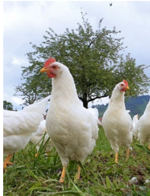
Nur entwurmen, wenn wirklich nötig.

Vorbeugende Massnahmen können die Anzahl der Wurmeier in und um den Stall reduzieren. Allerdings wirkt sich dies