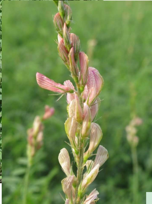
23. juin 2008