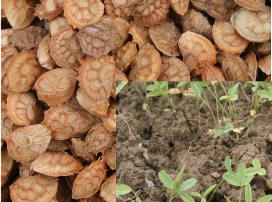
8. April (Saat)