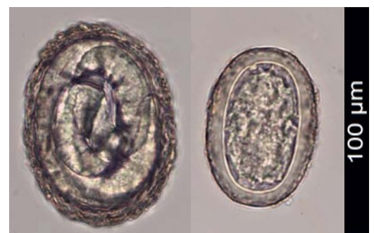
↑ Abbildung 1: Spulwurmei mit ansteckender Larve (links) und Spulwurmei mit abgestorbener Masse (rechts)