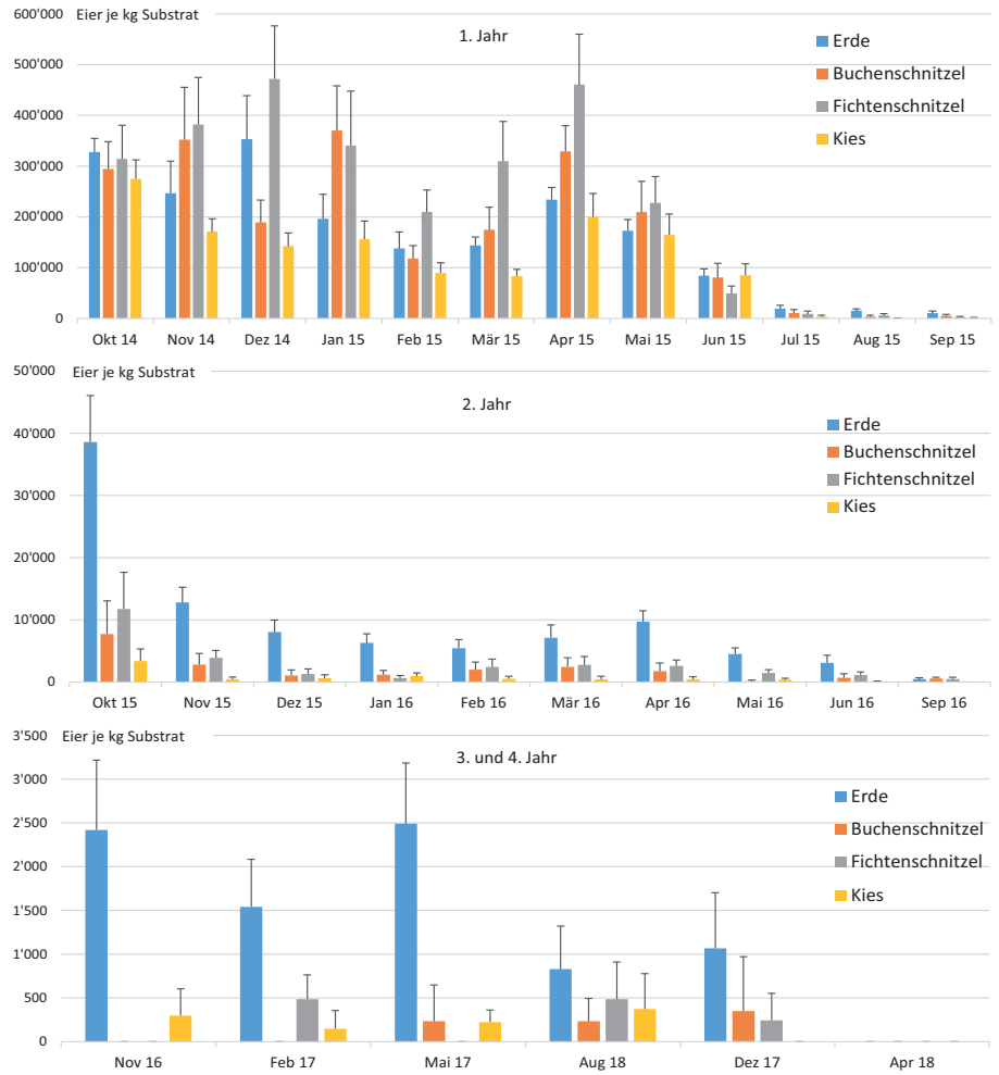
Abbildung 3: Überleben von Spulwurmeiern ( Ascaridia galli ) in den verschiedenen Einstreumaterialien bzw. in Erde. (Angabe in Anzahl Eier je kg Einstreu bzw. Erde, Balken = Mittelwert, Strich = Streuung)

Unsere Ergebnisse zeigen in Übereinstimmung mit anderen Untersuchungen, dass Einstreu die Überlebensdauer von Spulwurmeiern im Vergleich zu Erde reduziert. Da jedoch gegen 50% der Wurm-