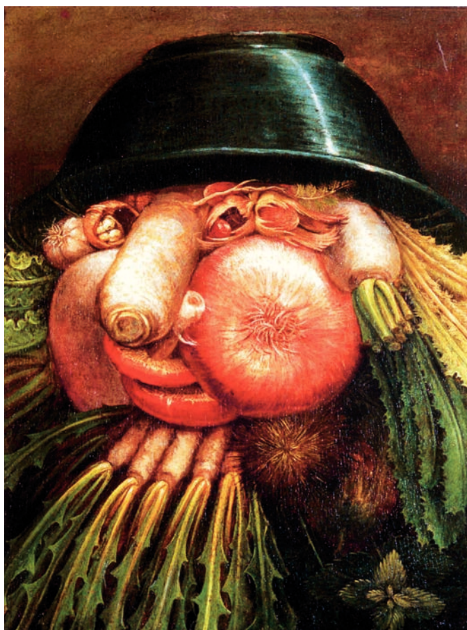
Mensch, die Suppe! Guiseppe Arcimboldo, Jahr 1590.