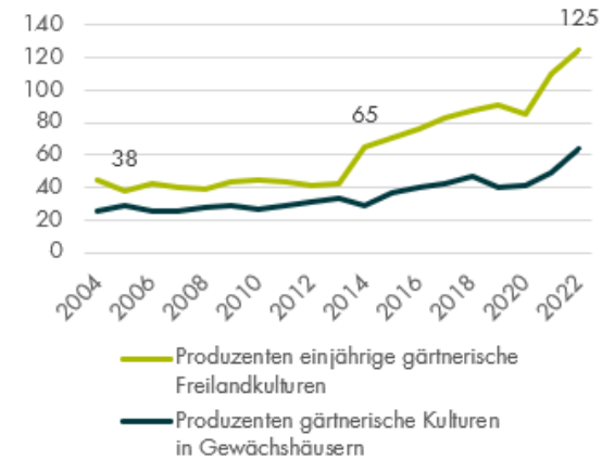
Bio-Betriebe mit gärtnerischen Kulturen