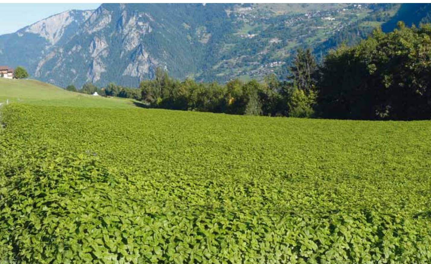
Figure 1 | Parcelle de Melissa officinalis à Bruson (VS), à 1050 m d'altitude. La variété 'Lorelei' (mediSeeds) est bien adaptée aux conditions pédoclimatiques de l'étage de végétation collinéen-montagnard suisse. Elle se caractérise par une bonne homogénéité, un port érigé en première année de culture, une bonne tolérance aux maladies et un potentiel de rendement élevé en feuilles et en acide rosmarinique.

Renseignements: Claude-Alain Carron, e-mail: claude-alain.carron@agroscope.admin.ch , tél. +41 27 345 35 11, www.agroscope.ch