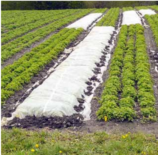
Figure 2 | Dispositif expérimental de Bruson lors de la pose de l'agrotextile, le 12 mai 2010. Quatre répétitions de 20 m 2 ont été couvertes.

tiges a été évalué par mondage manuel sur 100 g de matière sèche. L'HE a été titrée par hydrodistillation à la vapeur selon la méthode de la Pharmacopée européenne (tome 1; 2008). L'AR a été extrait des feuilles broyées et tamisées (1 mm). De la poudre séchée au dessiccateur durant 12 h, 100 mg ( \pm 0,0005 ) ont été prélevés et pesés dans des tubes 'Falcon' de 50 ml, puis complétés avec 10 ml d'EtOH/H 2 O (50%/50%), et le pH 2,5 ajusté avec de l'acide formique. Après un passage