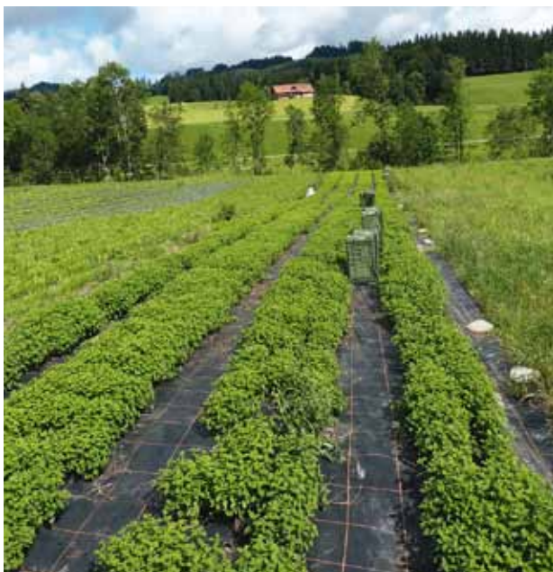
Figure 3 | Parcelle d'expérimentation d'Escholzmatt (LU) lors de la première récolte, le 27 juin 2012.

de dix minutes dans un bain à ultrasons à 60°C, les tubes ont été centrifugés quinze minutes à 5000rpm. L'extraction a été faite à trois reprises, puis complétée à 50 ml avec le tampon d'extraction à 20°C (fig. 4). Après filtrage, les extraits de 1,5 ml ont été placés au réfrigérateur à 4°C. La quantification de l'AR a été réalisée par HPLC par le groupe «Lebensmittelmikrobiologie,-analytik und Sensorik» d'Agroscope à Wädenswil sur une colonne Symmetry C18 de Waters avec un débit de 0,5 ml/min dans un éluant acide phosphorique 0,85%/méthanol 1:1 v/v. La quantité d'injection était de 20 µl, la température de la colonne de 25°C et la longueur d'onde de 330 nm. Les résultats ont été traités avec le logiciel XLSTAT (Anova, test de Tukey).