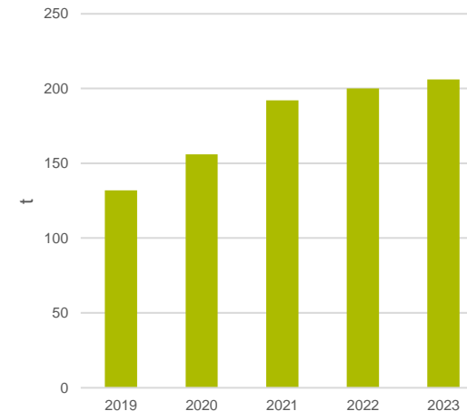
Produktion Schweizer Edelpilze (Austernseitlinge, Shiitake & Kräuterseitlinge)