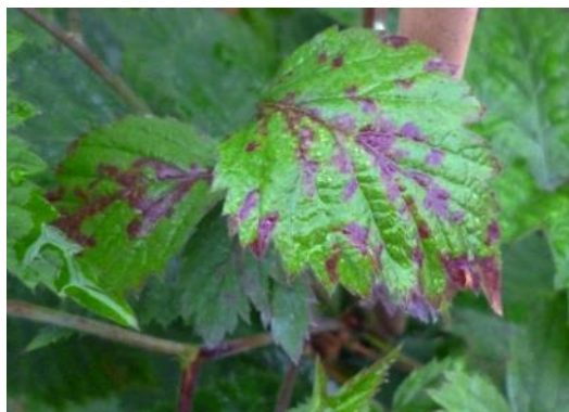
Falscher Mehltau (Peronospora) Blattsymptome bei Brombeere (thoh)

Befall durch falschen Mehltau an Brombeeren wird jetzt sichtbar: Der Befallsdruck ist aktuell als hoch einzustufen. Bestände kontrollieren auf Früchte, die hart und klein bleiben, statt zu reifen, oder auf rötliche Flecken auf den Blättern (s. Bild).