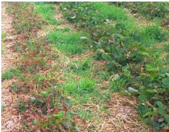
Nach der Ernte ist in den Erdbeeren die Begleitflora rechtzeitig zu regulieren, wie Ausfallgetreide und Quecken

Vorhandene Unkräuter sollten nicht zur Blüte kommen, um ein Aussamen zu vermeiden.