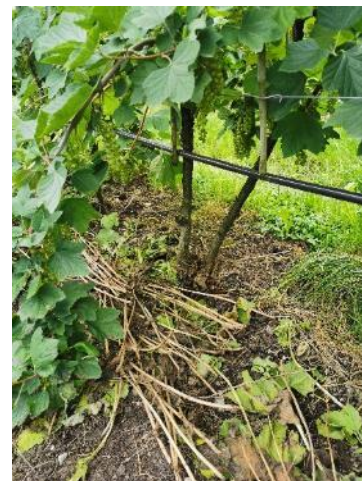
Bild: Bodentriebe bei Johannisbeeren sollten jetzt fertig ausgeschnitten sein

Düngung (Nachdüngung) bei allen Strauchbeeren beachten. Besonders aber Himbeeren und Brombeeren. Falls noch nicht geschehen, sollte zur Fruchtreife die dritte Düngergabe (Nachdüngung) erfolgen. Fertigation den aktuell stark wechselnden Temperaturen anpassen, d.h. bei Hitze weniger Dünger, längere Spülzeiten und bei kühlen Temperaturen umgekehrt. EC-Werte vom Eingang und Drän regelmässig überwachen.