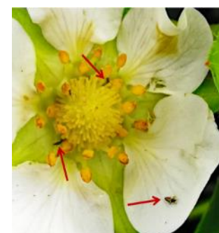
Thripse auf Frucht und in Erdbeerblüte