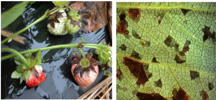
Bilder: Symptome Xanthomonas

Wegen des feucht-warmen Wetters sind verstärkt Kontrollen auf Xanthomonas (Bakteriose, Eckige Blattfleckenkrankheit) durchzuführen. Nach Ernte oder bei Neupflanzungen ohne Ernte sind Kupfer-Behandlungen zum Schutz/Eindämmung möglich.